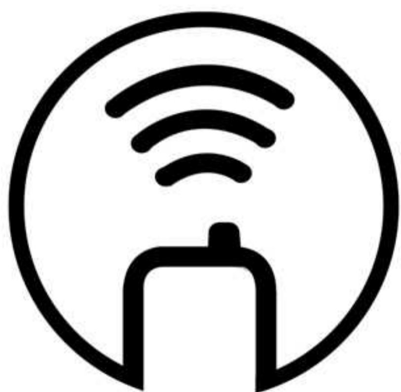
شبکه های مجازی